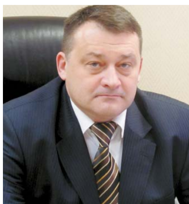
14 сентября состоятся выборы депутатов Московской городской Думы

Вы сами видите, какие положительные перемены происходят в нашем районе: благоустраиваются дворы, создается спортивная инфраструктура, совершенствуется система образования, здравоохранения и культуры, система социальной защиты населения.