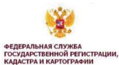
ФЕДЕРАЛЬНАЯ СЛУЖБА ГОСУДАРСТВЕННОЙ РЕГИСТРАЦИИ, КАДАСТРА И КАРТОГРАФИИ

С первого октября срок постановки на учет объекта недвижимости, учета изменений объекта недвижимости, учета части объекта недвижимости или снятия с учета объекта недвижимости сокращен с 20 рабочих дней до 18 календарных дней (статья 17 Закона о кадастре). Изменился вид документов, представляемых в орган кадастрового учета: межевой план, технический план и акт обследования, подтвержда-