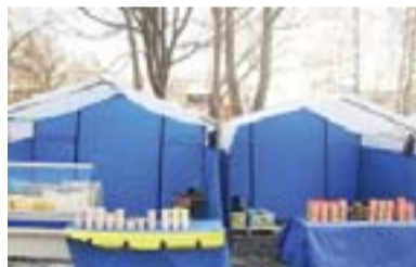
Все места на ярмарке «выходного дня» предоставляются на безвозмездной основе.

Участниками ярмарки являются граждане, ведущие крестьянское (фермерское) хозяйство, личное подсобное хозяйство или занимающиеся производством промышленных товаров.